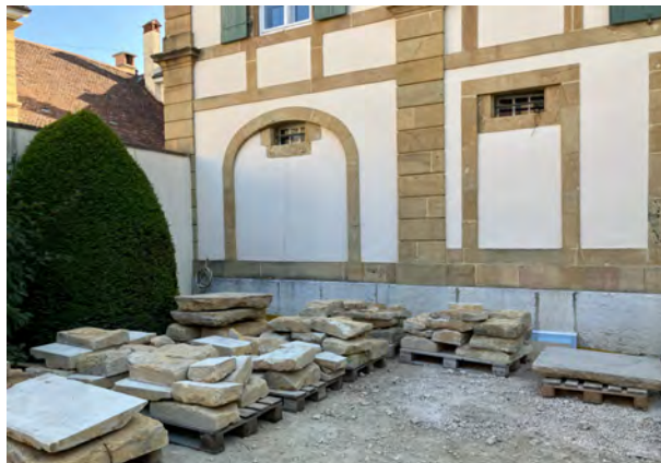
Abbruch und Ausbau der massiven Steinplatten über dem Gewölbe des Erdgeschosses.