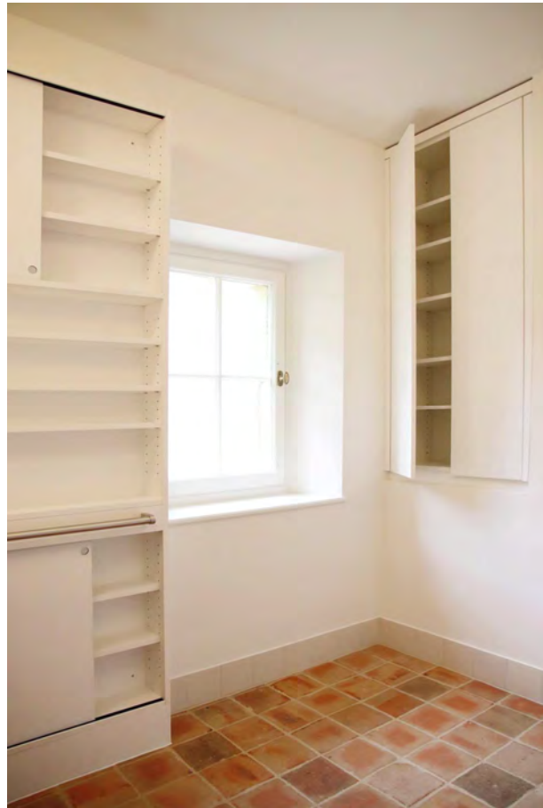
Das neue Bad bietet viel Stauraum und passt sich mit dem neuen Boden aus historischen Tonplatten in die Gesschichte des Hauses ein.